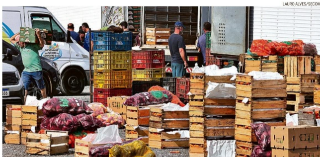
Contas. Ceasa retoma atividades em Gravataí; produtores tentam calcular quanto será perdido da produção de arroz e soja

As enchentes afetaram mais de 80% da atividade econômica do Rio Grande do Sul, segundo estimativa da Federação das Indústrias do estado, a Fiergs. Segundo a entidade, 67% dos municípios gaúchos foram atingidos.