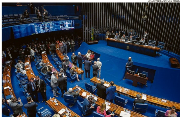
Plenário. Aprovação foi por 41 votos a favor e 28, contra; base governista prometeu veto pedido por opositor